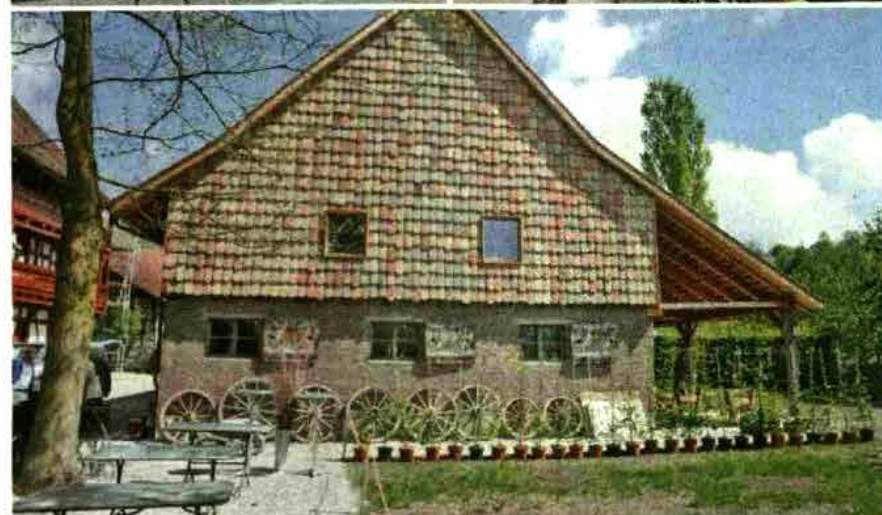
Stallgebäude mit Gartenbeiz